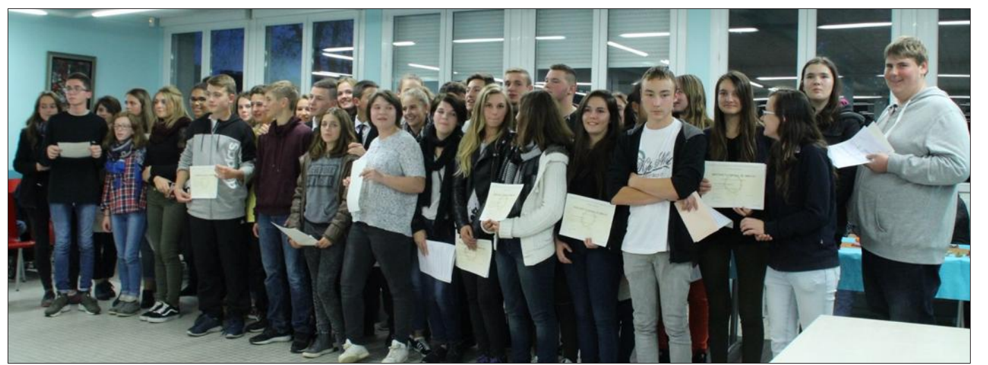
■ Ces anciens collégiens ont tous obtenu leur Brevet. Une cérémonie était organisée pour les mettre en lumière.

« C'est votre premier diplôme et c'est aussi une porte d'entrée pour le baccalauréat », a souligné le proviseur, « profitez bien de cette année, c'est la dernière sans examen. Celles qui viendront après seront sou-