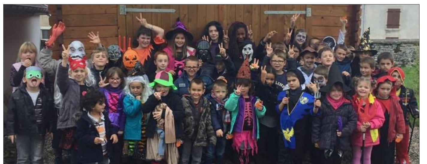
■ Quarante-sept enfants du RPI Arpenans-Pomoy-Mollans ont profité de l'activité organisée au périscolaire.

Au périscolaire, à chaque mois, un thème diffère. En novembre, le fil conducteur sera le cirque. Histoire de rappeler que le spectacle de Noël en préparation sera concocté par « les enfants de la balle ».